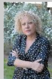
La cantante catalana Marina Rossell, que actúa en el Parque de España, regresa a Rosario con los temas de su último álbum.